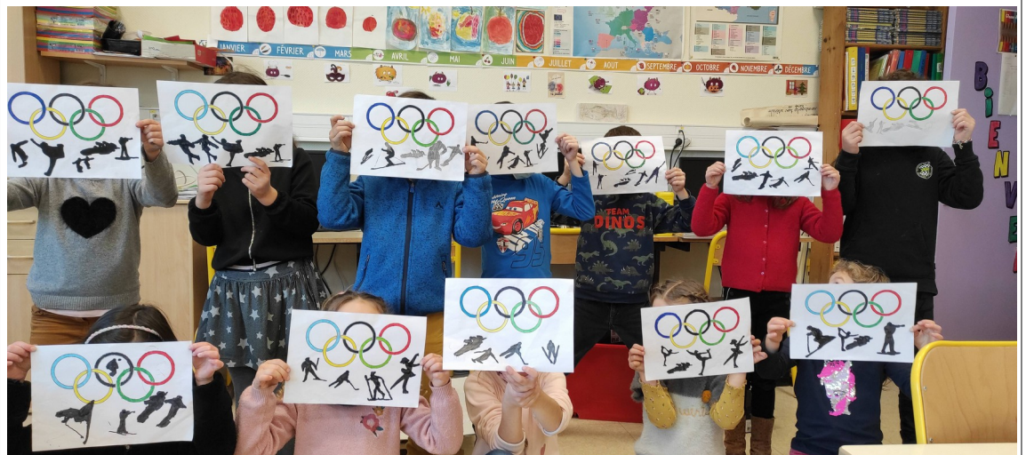
anneaux olympiques et silhouettes des sports présents aux JO d'hiver