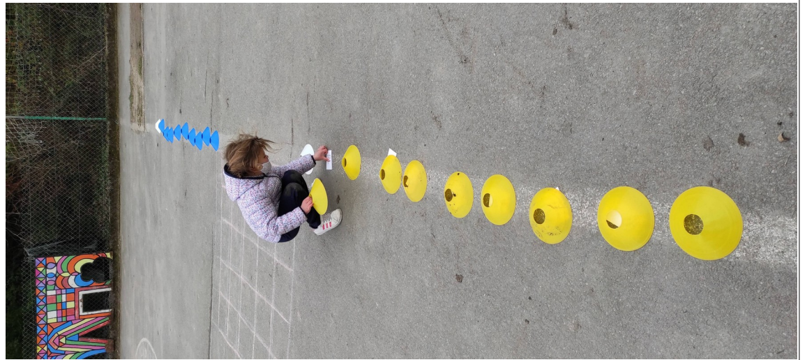
mémoire (table de 5 pour les CE1 / doubles pour les CP)