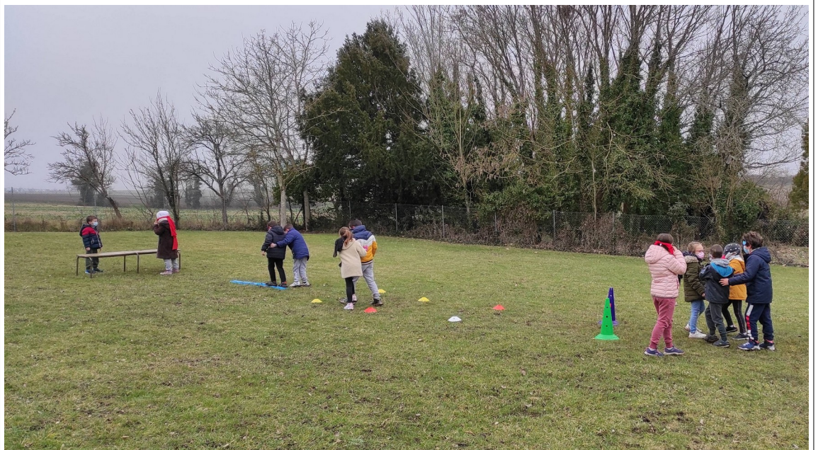
parcours « déficience visuelle »