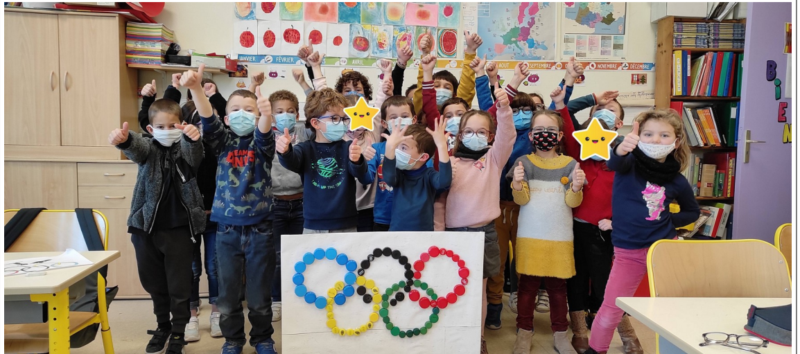
anneaux olympiques et recyclage (palette recouverte de tapisserie et bouchons en plastique)

Quizz Défi « la tête et les jambes » fin des projets artistiques