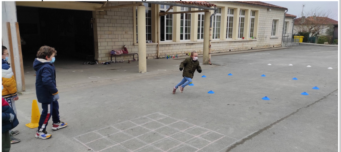
le grand 8

Ateliers sportifs et artistiques + réglette du plaisir