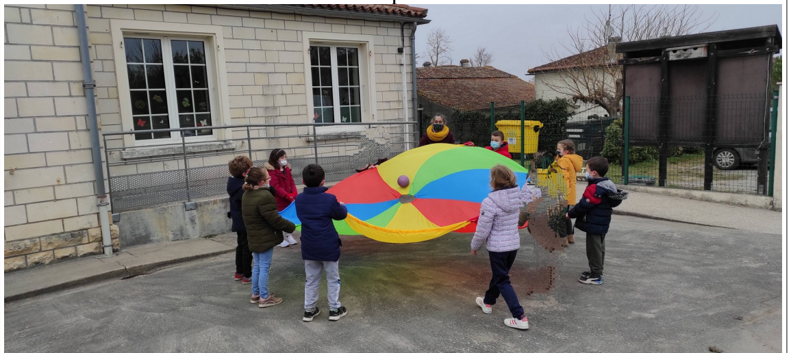
jeu coopératif : le parachute